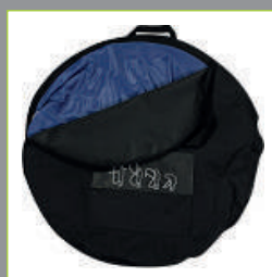
Sac de rangement pour le transporter facilement