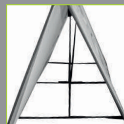
Assemblage des barres de renfort par velcro