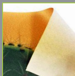
Tissu polyester 200 g/m 2 avec impression par sublimation